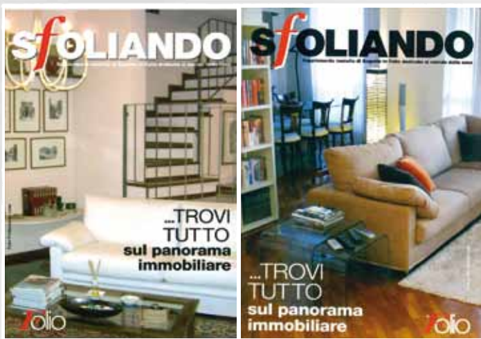
Supplemento mensile dedicato al mondo della casa 2003-2004

Ediesse srl non è solo inFolio. Numerosi i lavori che nel corso di questi 20 anni sono stati fatti. Qualche esempio? Dall'inserto "Like" dedicato al commercio locale, proseguendo con "Sfoliando" per le realtà immobiliari e "Buongustaio" piccola guida dei ristoranti, senza scordare opuscoli e libri per raccontare il territorio