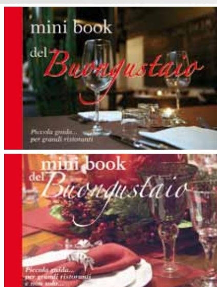
Guida tascabile dei ristoranti locali 2009