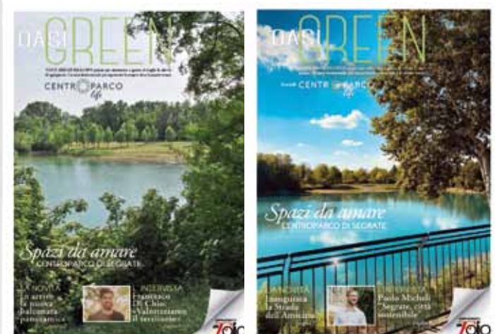
Supplemento dedicato al Centro Parco 2022