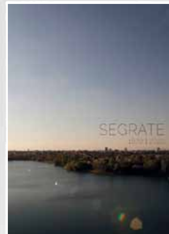
Libro per i 150 anni di Segrate 2020