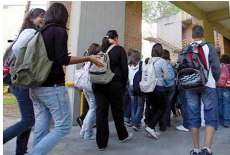
Sacro Cuore, che da tre anni sventava in cima all'elenco. Molto bene anche gli istituti tecnici della provincia, dove in cima alla lista