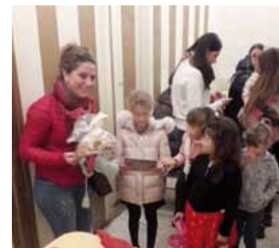
Che Natale sarebbe senza una tombolata da Gelati e Dolci di Campagna