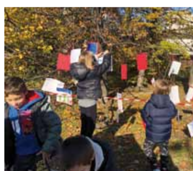
In giro per San Felice con Rappo e i disegni dei bambini della scuola Galbusera