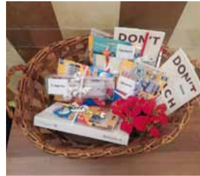
Al New Dada Bistrot grande partecipazione al torneo di burraco