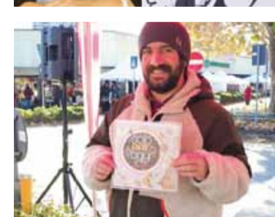
Da Icone Milano i bambini si sono sbizzarriti a fare il gelato